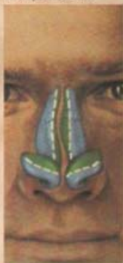
6. Para mejorar la vía aérea se puede variar la forma y posición del septo.

Su cirujano le revisará periódicamente para asegurar una adecuada recuperación.