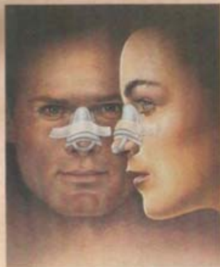
7. Se coloca una férula sobre la nariz para ayudar a conservar la nueva forma.